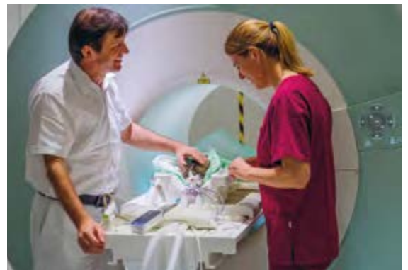
„Zu Beginn meiner Karriere war eine MRT-Untersuchung in der Veterinärmedizin noch undenkbar. Mittlerweile gehört sie zum Standard.“