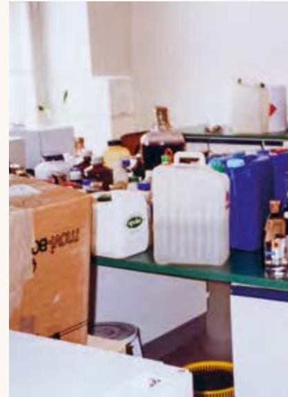
Nicht alles fand Platz in den Kartons. Auch historische Stücke blieben zurück.