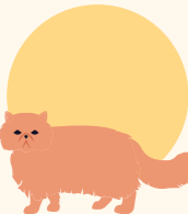
Hunde und Katzen mit kurzen Schnauzen (brachycephal) wie z.B. Chihuahua, Mops, Bulldogge, Malteser oder Perserkatze