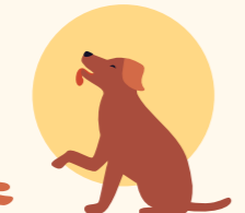
Haustiere, die vor kurzem in wärmere Gegenden übersiedelt wurden oder ein dickes Fell haben