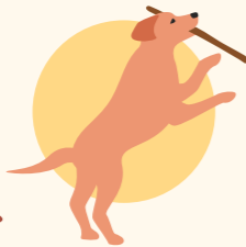
Haustiere, die sich bei heißem Wetter viel draußen bewegen