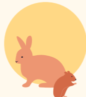
Haustiere in Käfigen, die keine kühlere Umgebung aufsuchen können