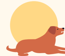
kranke Haustiere, insbesondere bei Herzproblemen, Schnarchen oder vorherigem Hitzschlag