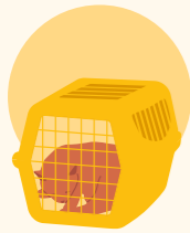
Haustiere, die bei warmen Temperaturen im Auto mitreisen