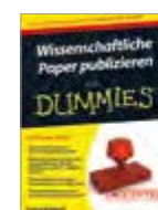
Bild der Ausgabe 22